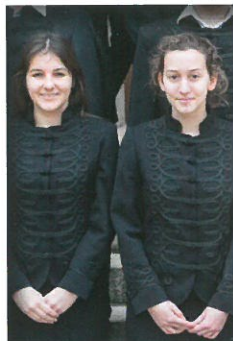
Iskolánk viselete a „bocskai”