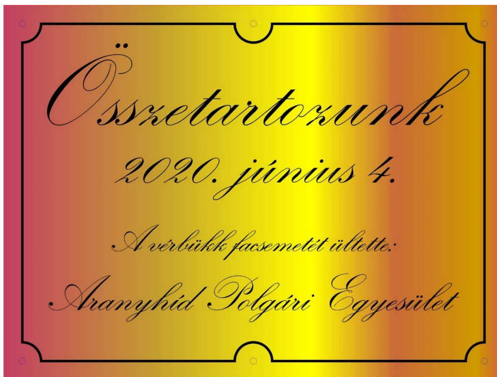
1. ábra Balatonalmádi nemzeti összetartozásunk 100 évfordulójának meghívója