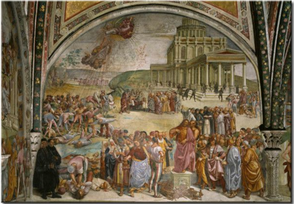
1. ábra2. ábra SIGNORELLI LUCA SERMON DEEDS ANTICHRIST, vagyis Luca Signorelli az Antikrisztus tetteinek prédikációja 1501.

„Mert valóban az Antikrisztus Krisztus alakjában jó s a földet paradicsommá teszi. Oly széppé teszi, hogy az emberek meg fognak feledkezni a mennyről. És ez lesz a legnagyobb kísértés a világra nézve. Miközben néha elbeszélgetünk arról, hogy vajon ki lesz az idők végén megjelenő Antikrisztus, hogy vajon politikus lesz-e, vagy maga a pápa, izraeli, vagy amerikai, észre sem vesszük a legnagyobb veszélyt (...)” 1 , azt, hogy a lelkünkben az igazság lakóhelyéül szolgáló ég 2 már régen eltűnt, életünk s a fejünk fölött 3 , s földhöz tapadt létünkben is rézzé 4 [תִּשְׁרֵט (nəḥōšet)] változott az égboltozat, amiről minden az ítélet halálos jégveréseként (2Móz 9:23-25) esik vissza reánk.