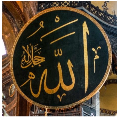
4. ábra Istanbul, a Hagia Sophia, Allah u akbar-ja

Melyek tehát a legfőbb jellemzői a Krisztus uralmával (Zsidók 1: 3) teljes menny ellentétjének? Pál ezt mondja: