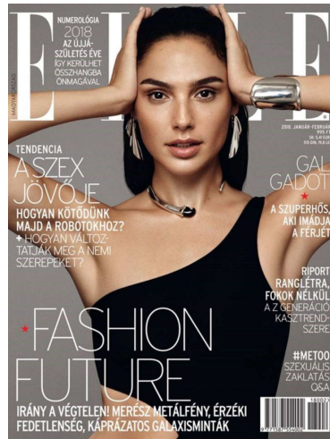
5. ábra az Elle magazin címlapja

Ezt a gátlástalanságot, amikor a testemben megremegeve végre megértettem, egyértelműen világos lett a Jelenések könyve következő prófécija: