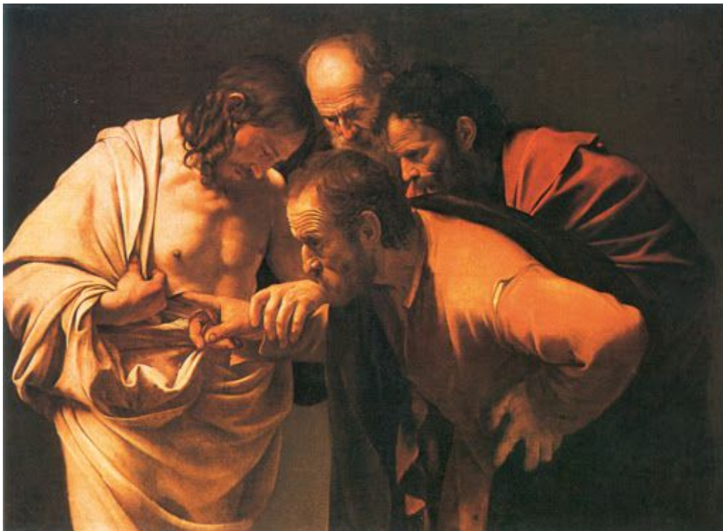
2. ábra Caravaggio: A hitetlen Tamás, 1601–1602, Sanssouci palota, Potsdam