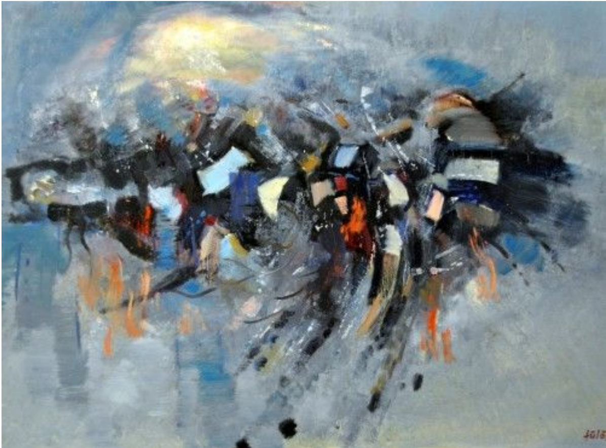
Ítra: Faust Gyula, Vörösberény 2021. május 30

Szentlélek munkája az, hogy akkor vagyok erős, amikor gyölkös vagyok